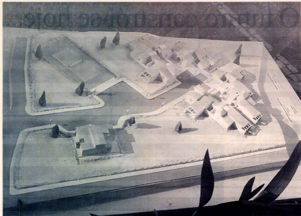
COMPLEXO turístico da Batalha

çar as estruturas das habitações principalmente nas zonas mais sísmicas. Teria de haver um planeamento imediato destas estruturas para que se faça uma prevenção adequada. Posteriormente, o Governo deveria incentivar as pessoas, mesmo concedendo apoios, para reforçarem e melhorarem as suas casas.